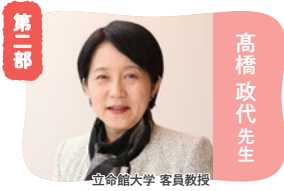
第二部 高橋 政代 先生 立命館大学 客員教授